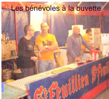
Les bénévoles à la buvette

De nombreuses images de ces événements sont visibles sur http://www.pap08.eu et http://plainair.free.fr/