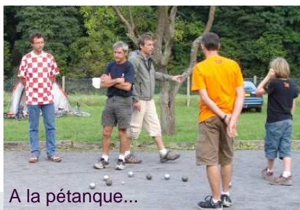
A la pétanque...