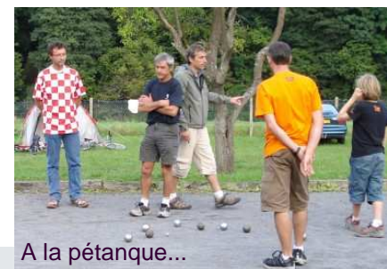
A la pétanque...

De nombreuses images de ces événements sont visibles sur http://www.pap08.eu et http://plainair.free.fr/