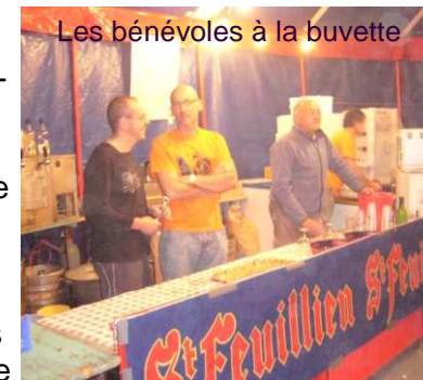
Les bénévoles à la buvette