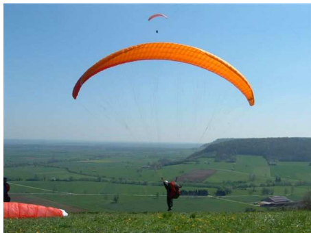
Une modification intervient cette année 2006 dans la règle.

Rappel : Depuis 1998, un challenge club récompense le pilote du club Pointe Ardennes Parapente ayant dans l'année parcouru le plus de distance sur trois vols effectués les samedi, dimanche et jours fériés au départ d'un site du département des Ardennes.